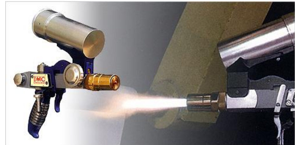
Projection de poudres à la flamme (PFS): Equipement