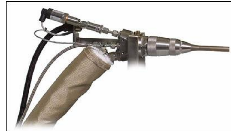
Projection au gaz froid (CGS): Technique