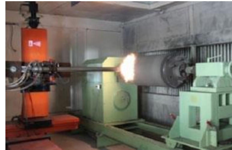
Métallisation par détonation (DGS): Equipement