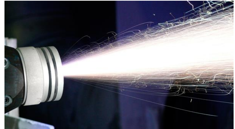
Métallisation au pistolet à arc électrique (AS): Technique